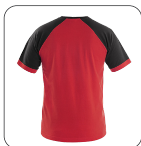
zadní strana back side z tyłu