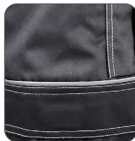
reflexní doplňky reflective accessories elementy odbłaskowe