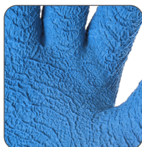
zdrsňený povrch crinkle finish szorstkie wykończenie