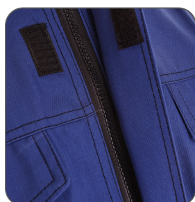
kryté zapínání covered zipper kryte zipięcie