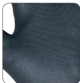
zdrsnělý povrch crinkle finish szorstkowane wykończenie