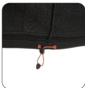
stahování v dolní části tightening on bottom part ściągacz w dolnej części