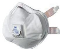
filtrační polomaska 8825