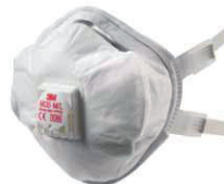
filtrační polomaska 8835